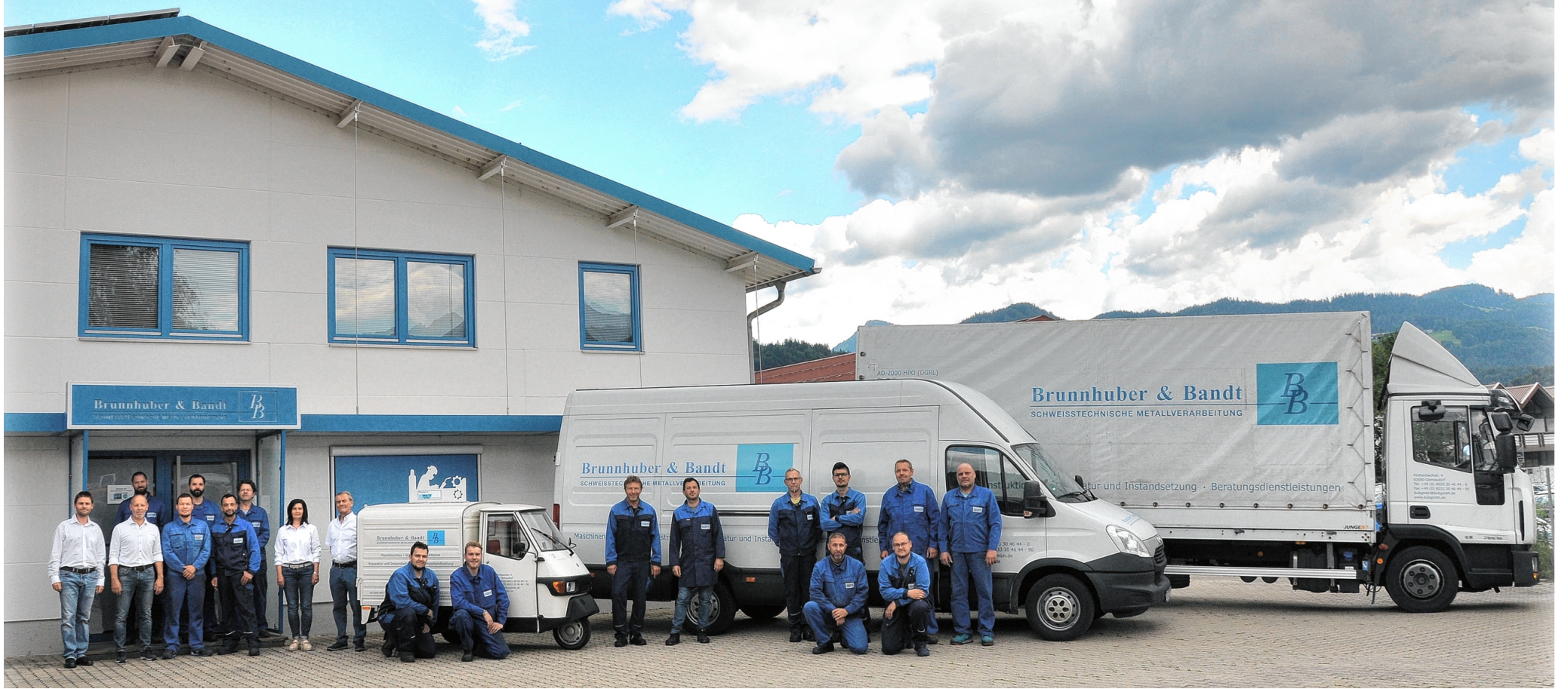
Das Team der Firma Brunnhuber und Bandt. Die beiden Geschäftsführer sind stolz auf ihr hoch qualifiziertes Personal.

Mit großer Begeisterung wurden 1984 die neuen Räumlichkeiten im Gewerbegebiet Oberaudorf bezogen, die in den darauffolgenden Jahren und mit der nächsten Generation sukzessive ausgebaut und erweitert wurden.